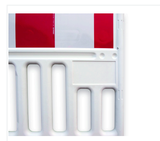
Indywidualne pole reklamowe