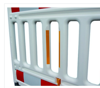
Folia odblaskowa na belce poprzecznej (opcjonalnie)