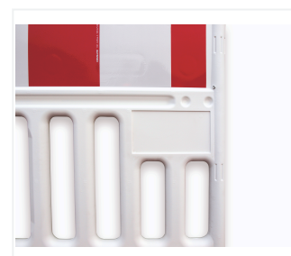
Indywidualne pole reklamowe