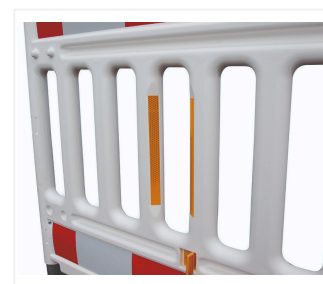
Folia odblaskowa na belce poprzecznej (opcjonalnie)