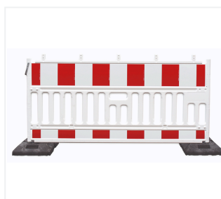
Zapora drogową z kratą w podstawie

070437-3 070437-3-01 071662-1 082650 002090-5