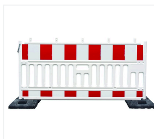
Zapora drogowa z kratą w podstawie

002090-5 082650 071662-1 070437-3-01 070437-3