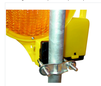
BakoLight z uchwytem do masztu