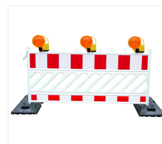
BakoLight na zabezpieczeniu przed upadkiem