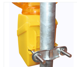
MonoLight z uchwytem do masztu