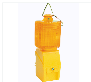
Światło obrotowe MonoLight