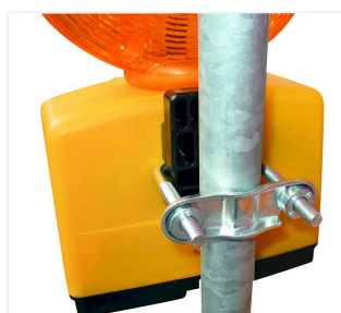
Z uchwytem masztu