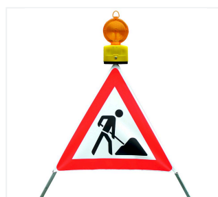
Nitra LED na znaku składanym