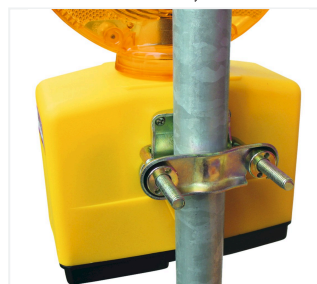
Nitra LED z uchwytem do masztu