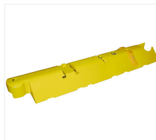
System progów kierujących Quick Marker