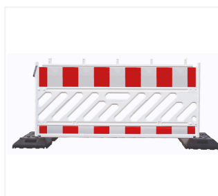
Zapora drogowa z kratą w podstawie

070437-3 070437-3-01 071662-1 082650 002090-5