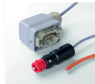
6-biegunowa wtyczka okrągła i wtyczka samochodowa