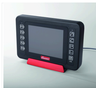
Touch Remote w uchwycie ładowania