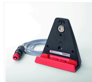
Ładownica z wtyczką samochodową