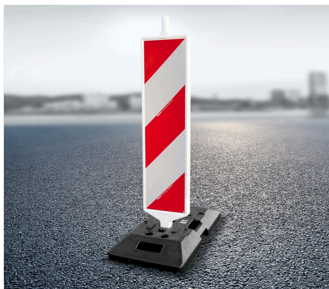
Standardowy ogranicznik skrajni na podstawie K1