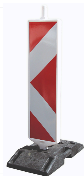
Ogranicznik skrajni drogi w Kompakt K1